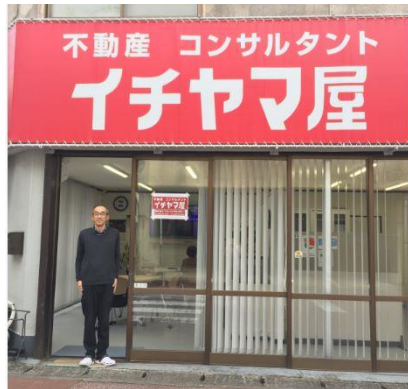
赤い看板が目印のお店です！

不動産業者として、過疎地域で問題となっている空家等の住まい・暮らしの相談にお答えさせて頂く事が、川本町の人口減少問題の解決につながり町の賑わいを取り戻す事になると思います。今後は「イチャマ屋」の存在を広めていき、暮らしのコンサルタントとして町の皆さまに愛されるお店になりたいと思っています。